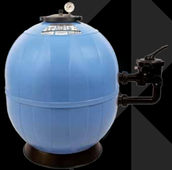
Poseidon™ mit ClearPro Technology®